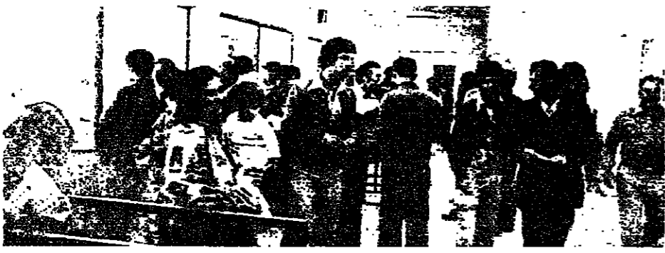
الارتحام داخل مركز الضمان في صيدا

صيدا - من مراسل «الانوار» : لا يكفينا ما نحن به في الجنوب من ويلات ، حتى نأتي الى صيدا ، وبعد احد ينجز لنا معاملة الا بمعجزة ، وبعد ان تلقى اوصافنا ، ان القرار الذي اتخذه مركز الضمان في صيدا بعدم تسليم اي معاملة بعد الساعة العاشرة من كل يوم ، يؤذي كثيرا على الضعفاء من ابناء القري الحدودية .. فقولنا اما عليهم ان يتركوا تراسم مع الفجر او ان يبيتوا في صيدا لينتقوا من الوصول الى مركز الضمان قبل الساعة العاشرة .